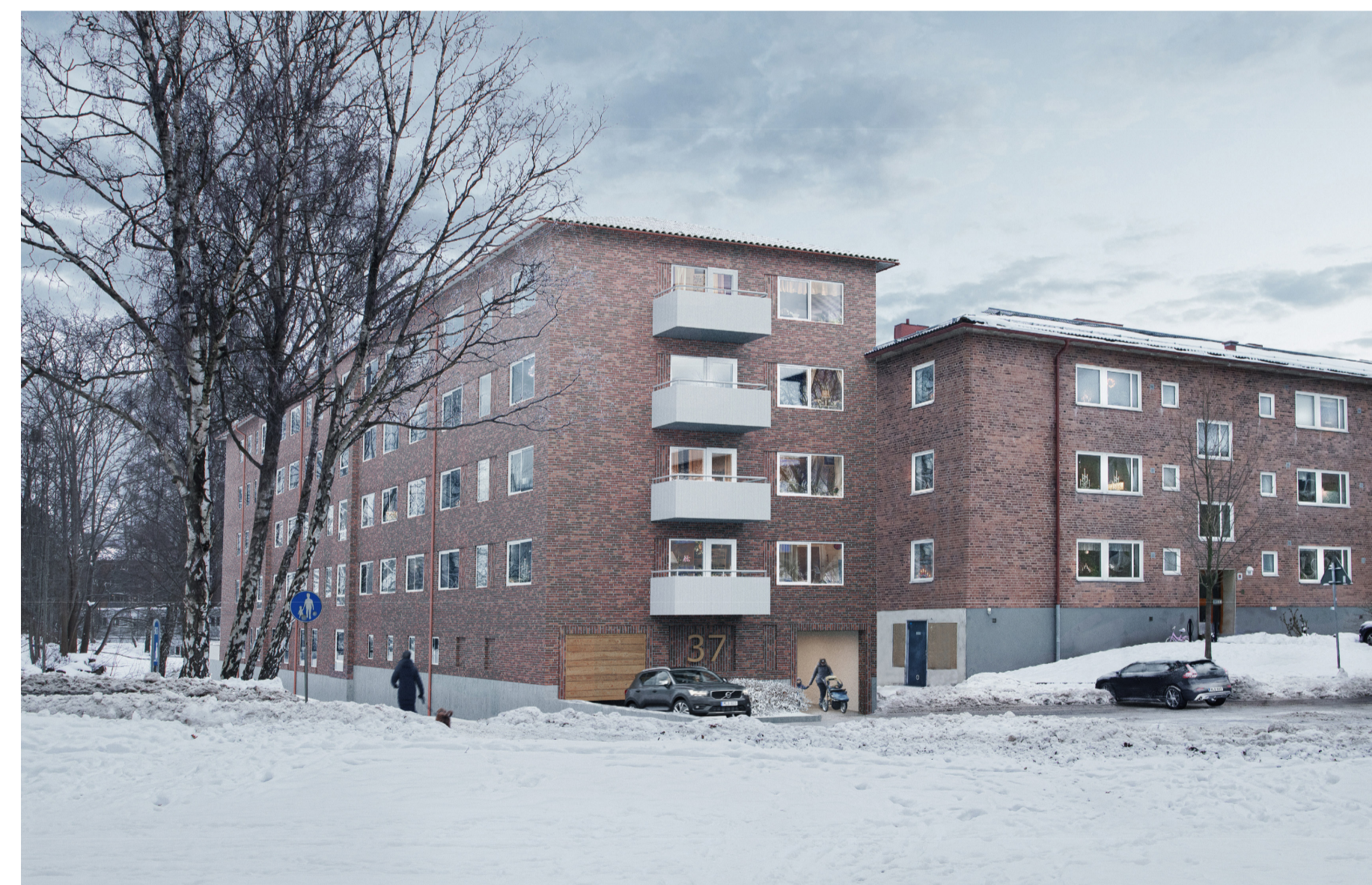
Fotomontage över föreslagen byggnad med 5 våningar, vy från Stabbegatan i väster. Liljewall arkitekter.